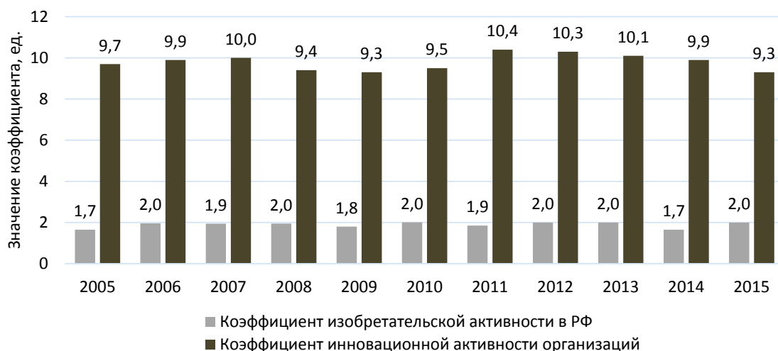
Рис. 3. Динамика коэффициентов изобретательской и инновационной активности в России за 2005–2015 гг. [5; 15]

исследованиями и разработками, в 3 раза меньше, чем в США [15; 16]. Особые индикаторы, отражающие уровень развития предпринимательских способностей и интеллектуального потенциала бизнеса – коэффициенты изобретательской и инновационной активности – демонстрируют отсутствие какой-либо значимой положительной тенденции в инновационной сфере (рис. 3).