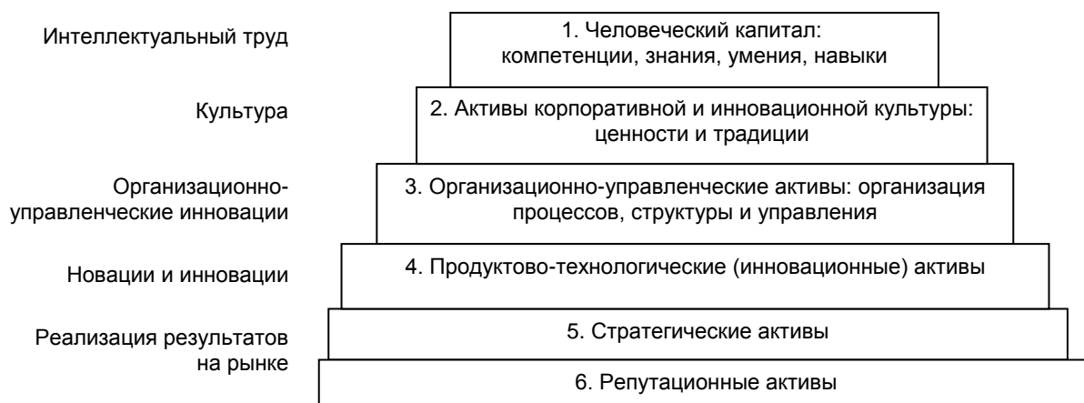
Рис. 3. Пирамида интеллектуального капитала по В.П. Баранчеву

числе ноу-хау, в принципе отделимые от физических лиц (работников) и от фирмы.