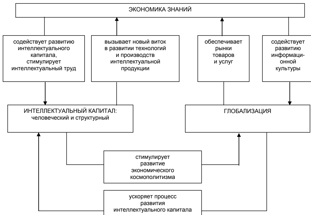
Рис. 2. Интеллектуальный капитал в системе взаимосвязей мировых тенденций развития экономики знаний