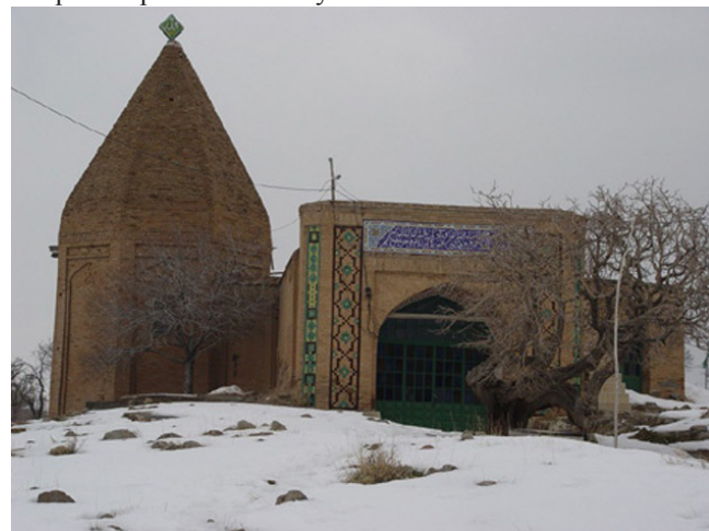
Рисунок 1 - Мавзолей Али Имамзаде в Шакернабде.

Вход в комплекс Харам находится на правой стороне. Для того, чтобы зайти сюда со стороны Шебистан , здесь спроектирована простая и сбалансированная арка. Есть стрелка в виде креста, прикрепленная к мавзолею через Шебистан . В направлении восток-запад длина этой стрелки больше. Вход в здание находится в начале этой стрелы, т.е. на востоке. С каждой стороны входа есть письмо, написанные на глазурованной плитке. Арка не так уж и глубока. В этой неглубокой впадине находятся две лоджии. Арка непосредственно достигает пространства входа в Шебистан . У этого пространства на обеих сторонах план является квадратным, есть лоджии, которые имеют два тротуара. Пространство Шебистана покрыто притолокой и куполами.