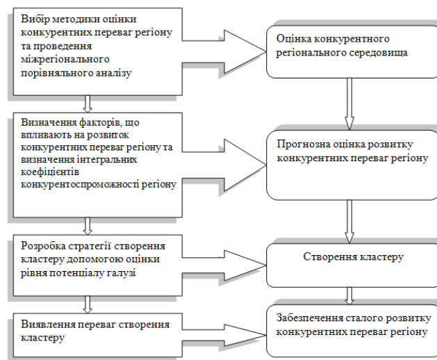
Рисунок 3 – Алгоритм реалізації кластерної моделі до забезпечення сталого розвитку конкурентних переваг регіону (Авторська розробка)

У зв'язку з тим, що спостерігається недостатнє методичне забезпечення кластерного підходу, виявлено необхідність його розширення за допомогою розробки алгоритму його реалізації з метою забезпечення сталого розвитку конкурентних переваг регіону (рис. 3), що припускає виконання певних дій, спрямованих на досягнення відповідних результатів.