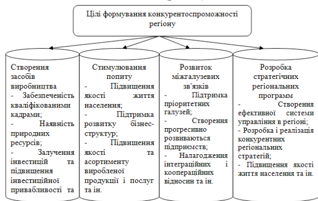
Рисунок 1 - Цілі формування конкурентоспроможності регіону (Авторська розробка).

Вклад основного матеріалу. В умовах ринкових відносин відбувається об'єктивне підвищення ролі і значимості регіональної економіки. Конкурентоспроможність регіону служить важливим напрямком його інтеграції у світову господарську систему. В рамках програмно-цільового підходу, необхідна структуризація цілей формування конкурентоспроможності регіону за допомогою виділення її основних цілей (рис. 1).