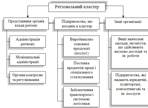
Рисунок 2 - Типова структура створення регіонального кластеру (Авторськ. розробка).

Представляється доцільним запропонувати наступну структуру створення регіонального кластеру (рис. 2).