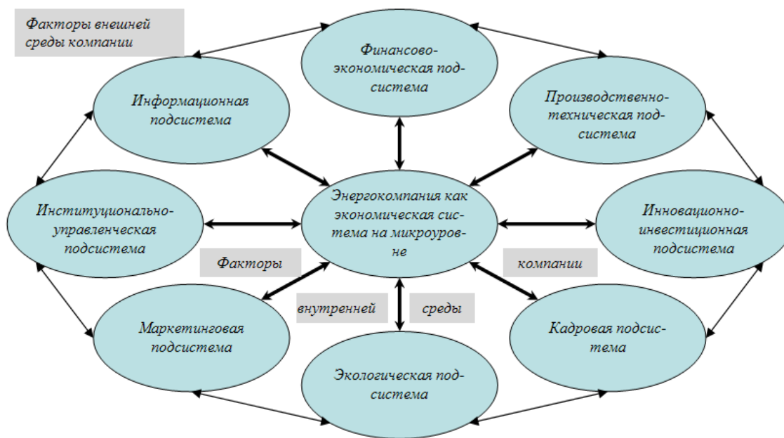
Рис. 1. Концептуальная схема энергокомпании как открытой экономической системы на микроуровне

компании и иметь в итоге долгосрочные инвестиционные программы, в основе которых лежит оценка потенциальных инвестиционных возможностей организации. Данный факт, а также проведенный анализ работ по проблематике инвестиционного потенциала позволяют рассматривать графическую модель соподчиненности и взаимосвязи таких экономических категорий, как инвестиционные ресурсы, инвестиционный потенциал, инвестиционная привлекательность, инвестиционный климат, инвестиционная среда и инвестиционная политика энергокомпаний, формирующаяся под воздействием этих категорий (рис. 3).