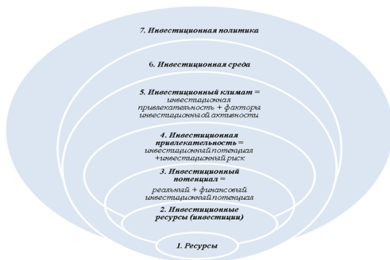
Рис. 3. Графическая модель соподчиненности и взаимосвязи основных экономических категорий, связанных с инвестиционным потенциалом региональной энергокомпании

В соответствии с данной моделью следует вывод о компонентном составе ресурсов энергокомпании, о соотношении и взаимосвязи таких экономических категорий, как инвестиции и инвестиционные ресурсы. Под инвестиционной привлекательностью региональной энергокомпании следует понимать такое состояние инвестиционного потенциала открытой экономической системы, которое соответствует допустимому уровню риска и гарантирует прибыльное вложение инвестиционных ресурсов в осуществляемые инвестпрограммы и проекты. Взаимосочетания инвестиционной привлекательности и факторов инвестиционной активности, посредством кото-