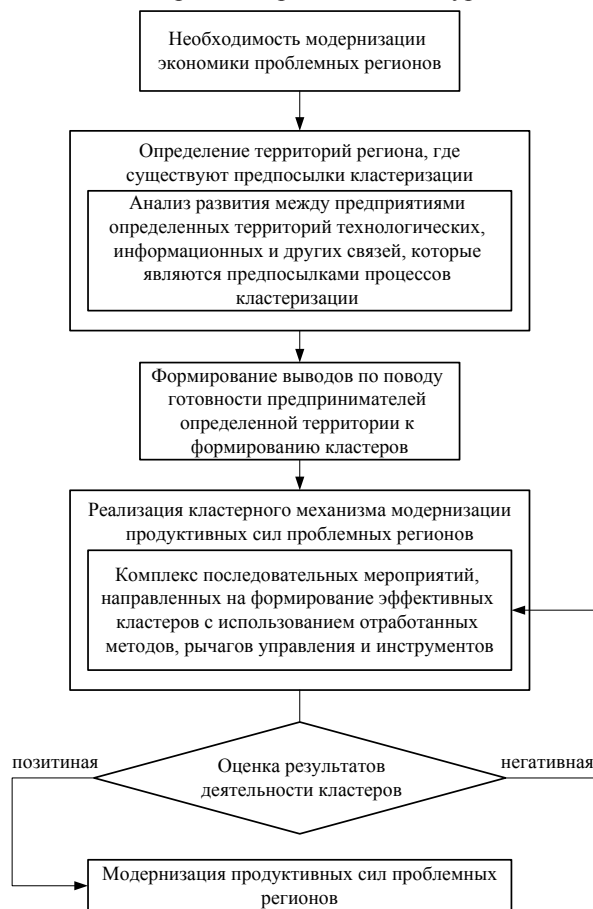
Рисунок 2 – Алгоритм использования кластерного механизма модернизации экономики проблемных регионов

этом будет обеспечено увеличение доли проектов, финансируемых с учетом приоритетов развития кластеров, а также тех, которые отбираются на конкурсной основе;