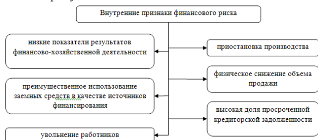
Рис. 3. Внутренние признаки финансового риска

Внутренние признаки финансового риска представлены на рисунке 3.