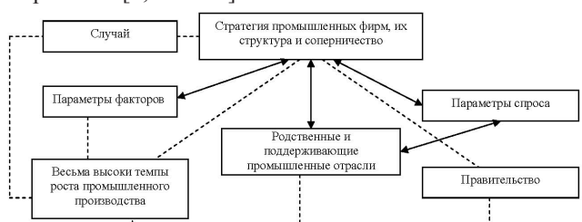
Рис. 1. Предлагаемая общая система конкурентного преимущества в промышленности Азербайджанской Республики.

В блоке «Правительство»: в действиях правительства Республики четко задействованы все имеющиеся элементы управления в системе рыночной экономики, в частности фискальная, финансово-кредитная, научно-техническая, амортизационная политика, государственное предпринимательство, планирование и регулирование [9, с.20-26].