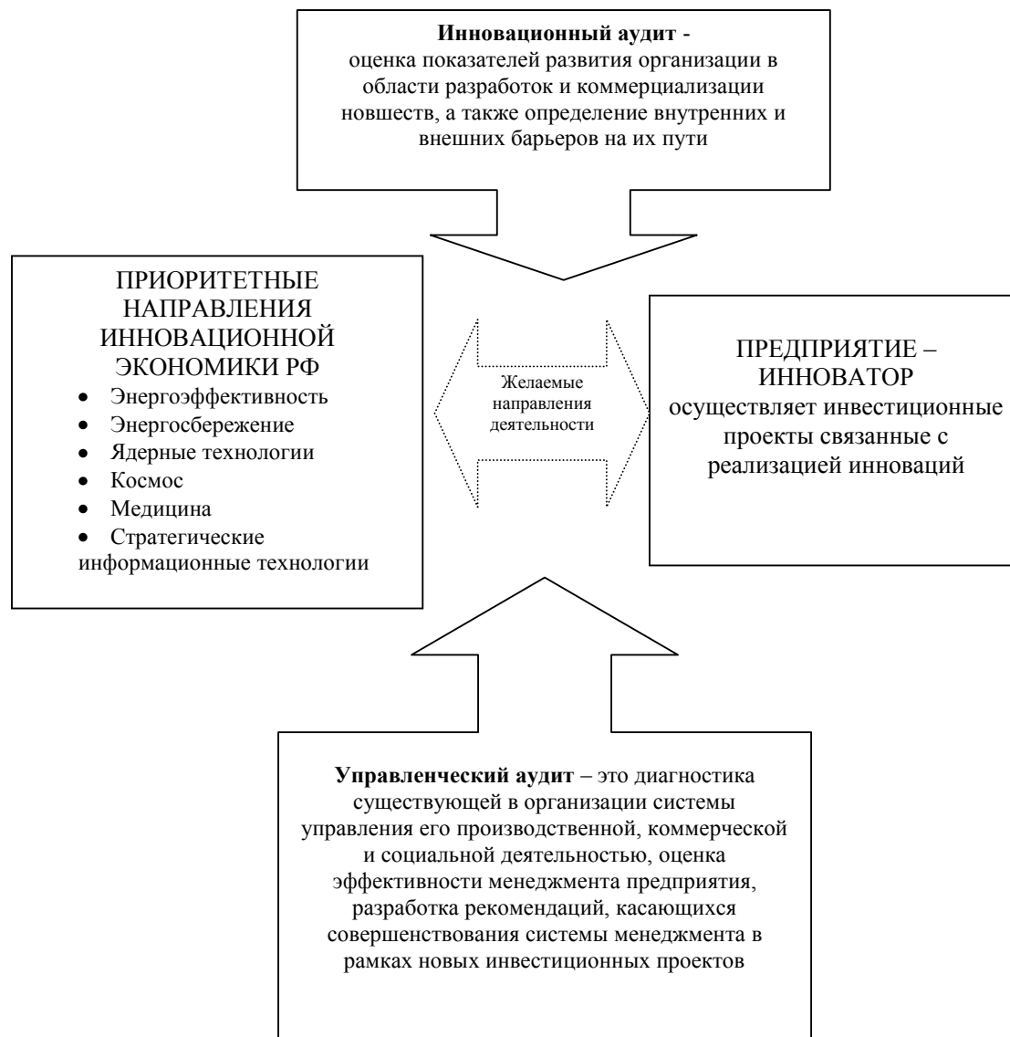
Рис. 1. Взаимосвязь инновационного аудита и управленческого аудита.