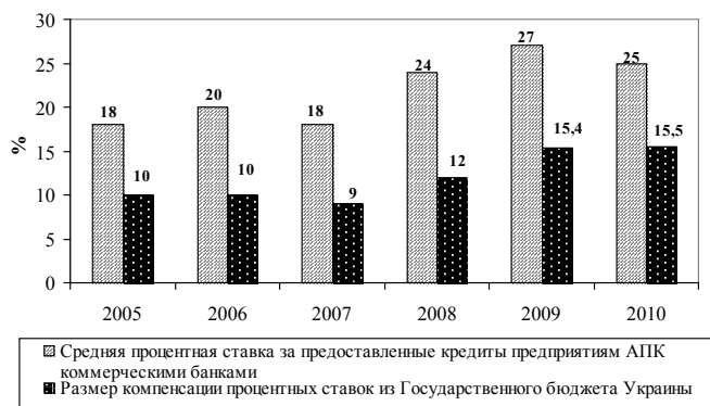
Рис. 2 Уровень процентных ставок по предоставленным кредитам предприятиям АПК в национальной валюте по 2005 - 2010 годы

держки малых аграрных предприятий не дает положительных сдвигов из-за несовершенства нормативно – правовой базы по осуществлению финансовой поддержки предприятий АПК, которая не обеспечивает достоверное и обоснованное определение потребности в компенсационных средствах, а также приводит к потере права на получение компенсационных средств.