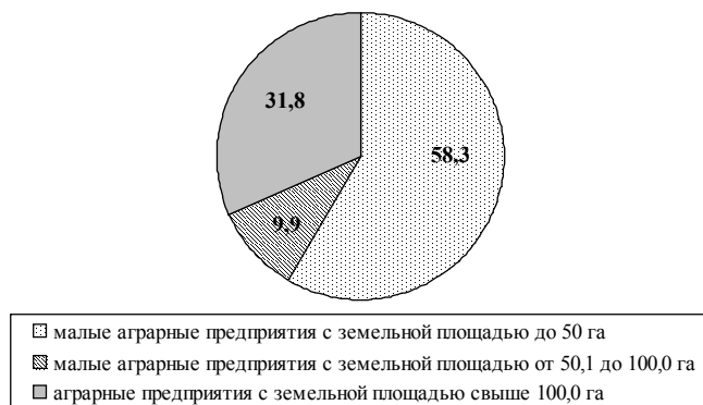
Рис. 2. Удельный вес малых аграрных предприятий по площади угодий в общем количестве аграрных предприятий в 2010 году

В целом удельный вес земель, закрепленных в 2010 году за малыми аграрными предприятиями составляет более 65% в общем количестве предприятий (рис. 2)