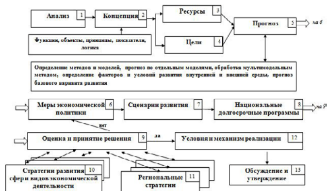
Рис. 3. Логико-функциональная схема разработки стратегии развития экономики на долгосрочную перспективу

услуги, удовлетворять экономические потребности общества и, в то же время, они являются ограничениями для роста экономики.