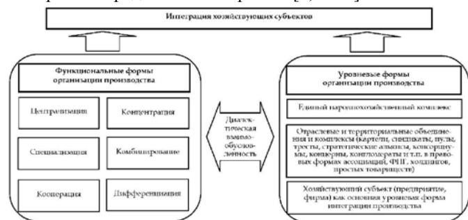
Рис. 1. Интеграция хозяйствующих субъектов как синтезирующая закономерность

По мнению Попова А.А. в обобщенном виде интеграция хозяйствующих субъектов как синтезирующая закономерность представлена на рис. 1. [7, с. 56]