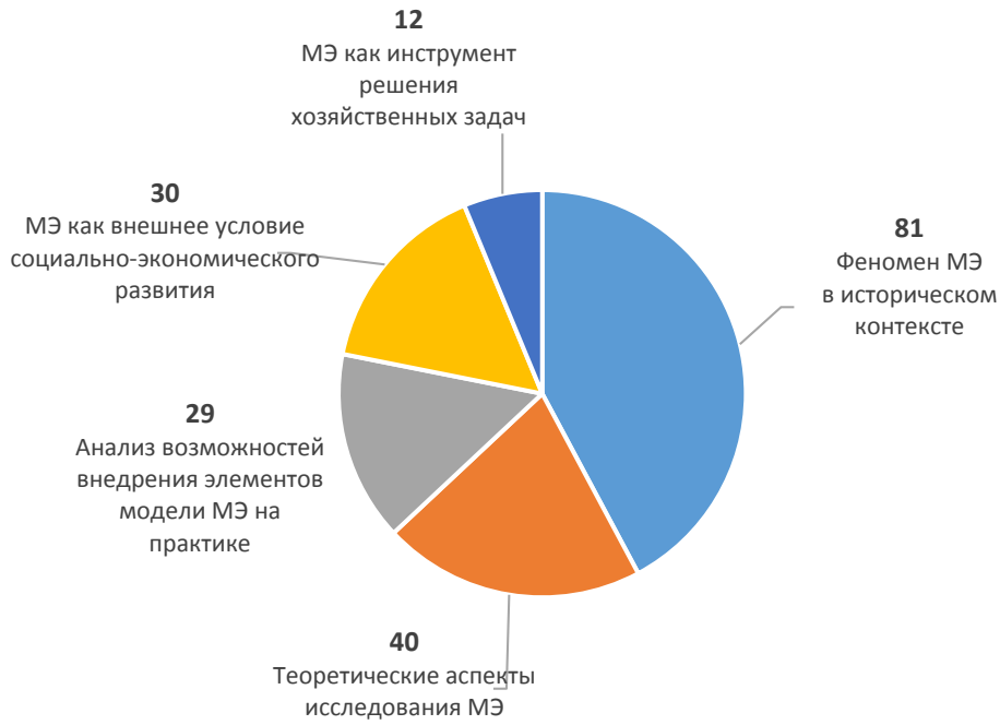
Рис. 2. Тематическое распределение публикаций по проблематике мобилизационной экономики в усеченной выборке, ед. На рисунке принято обозначение: МЭ – мобилизационная экономика